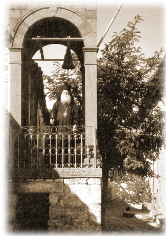
Στὴν δευτέρα ἐξορία. Λέσβος, Μονὴ Ὑψηλοῦ. (1951-1952)