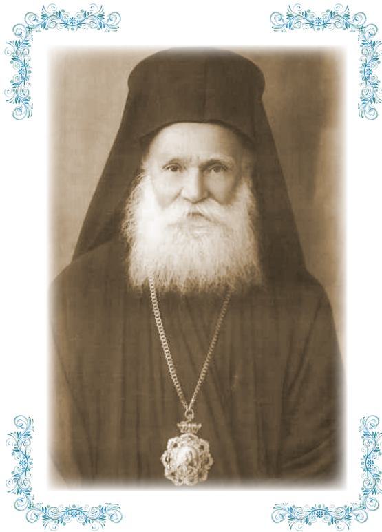
Ὁ Ἅγιος Χρυσόστομος ὁ Νέος Ὁμολογητὴς Ἱεράρχης 1870-1955