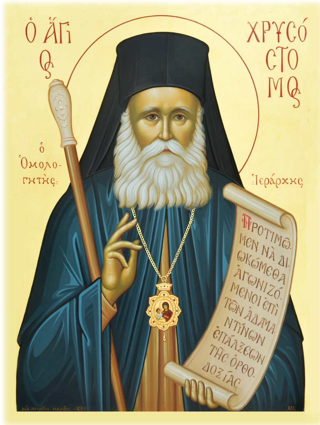
Ἡ πρώτη ἱερὰ Εἰκόνα τοῦ Ὁμολογητοῦ Ἱεράρχου. Ἔργον τοῦ «Ἐργαστηρίου Ἐκκλησιοποιημένης Εἰκονογραφίας». Μάρτιος 2016, Φυλὴ Ἀττικῆς. Διαστάσεις πρωτοτύπου: 50 x 70 ἐκ.