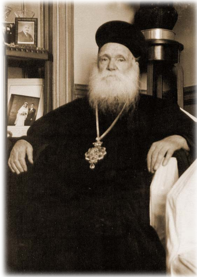
Ο Όμολογητής Ιεράρχης εις την οικίαν του, Κυψέλη Ἀθηνῶν, μετὰ τὴν ἐπιστροφὴν του ἐκ τῆς ἐξορίας. (1952)