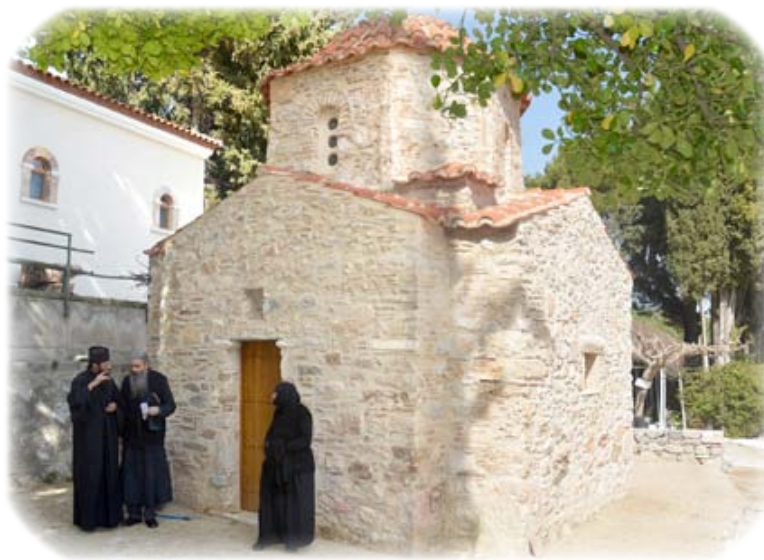
Ὁ Ἱερός Ναός τοῦ Ἁγίου Νικολάου (ΙΒ΄ αἰ.) στὴν Ἱερὰ Μονὴ Κοιμήσεως τῆς Θεοτόκου, Θρακομακεδόνες Πάρνηθος Ἀττικῆς, πρὸ τοῦ ὁποίου εὐρίσκεται ὁ Τάφος τοῦ Ὁμολογητοῦ Ἱεράρχου.