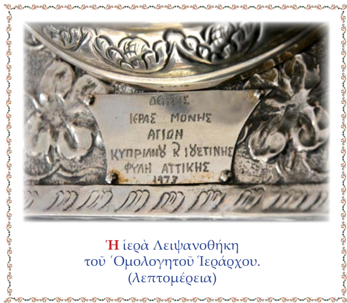
Ἡ ἱερὰ Λειψανοθήκη τοῦ Ὁμολογητοῦ Ἱεράρχου. (λεπτομέρεια)