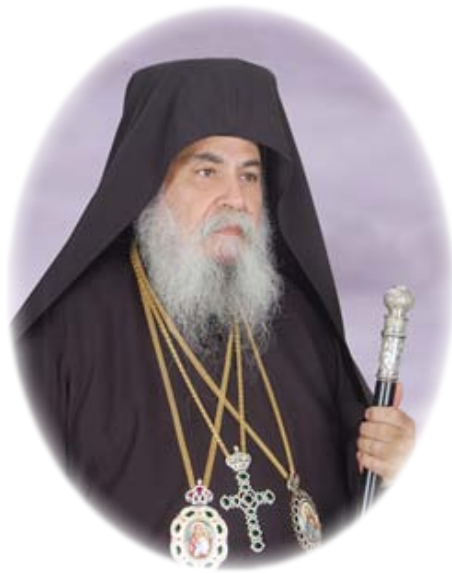
Ὁ Μακαριώτατος Ἀρχιεπίσκοπος τῆς Ἐκκλησίας τῶν Γνησίων Ὁρθοδόξων Χριστιανῶν Ἑλλάδος κ. Καλλίνικος. (2010 κ.έ.)