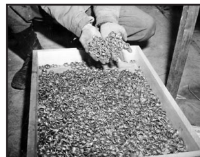
Βέρες καὶ χρυσὰ δόντια πὺ ἀφαιρέθηκαν ἀπὸ θανατωθέντες κρατούμενους.

Τ ὰ ὑπάρχοντα τῶν θυμάτων συλλέγονταν καὶ ξεδιαλέγονταν πρὶν ἀποσταλοῦν στοὺς Ράιχ. Τ ὰ ἀνθρώπινα μαλλιά καθαρίζονταν μὲ ἀτμό, συσκευάζονταν σὲ μπάλες, στέλνονταν στὴν Γερμανία καὶ χρησιμοποιοῦνταν στὴν στρωματοποιΐα.