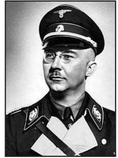
Χάινριχ Χίμλερ (1900-1945).

Ἡ δίωξη συνεχιζόταν καὶ γινόταν ἐντονότερη. Οἱ Ἑβραῖοι πιάνονταν ὄμηροι καὶ ὑφίσταντο διαρκῶς χλευασμοὺς καὶ ταπεινώσεις. Οἱ Γερμανοὶ βίαζαν τὶς γυναῖκες τῶν Ἑβραίων ἀτιμώρητα, βεβήλωναν καὶ ἔκαιγαν τὶς συναγωγές τους. Λ εηλατοῦσαν τὰ καταστήματά τους καὶ ἄρχιζαν νὰ τοὺς ἐκτελοῦν. Ἐ ργαζόνταν «κυνήγι Ἑβραίων» καὶ ὅταν συλλαμβάνονταν ραβῖνοι, τοὺς ἔκοβαν ἢ τοὺς ξερίζωναν τὴν γενειάδα. Οἱ Ἑβραῖοι ἔπρεπε νὰ κάνουν τὶς πιὸ βρόμικες καὶ πιὸ ἄθλιες δουλειές: Ν ὰ καθαρίζουν τὰ ἀποχωρητήρια μὲ τὰ χέρια τους, νὰ μαζεύουν τὰ περιττώματα ἀλόγων ἀπ' τὸν δρόμο καὶ νὰ γεμίζουν μ' αὐτὰ τὰ καπέλα τους καὶ τὶς τσέπες τους.