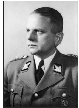
Ὁτο Ὀλεντορφ (1907-1951).

Ἐπιπλέον, στὴν Συμφερούπολη ὅπου ἐξοντώθηκαν 10.000