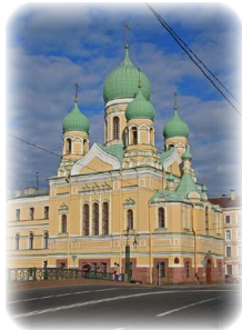
Ὁ ἱερὸς Ναὸς τοῦ Ἀγίου Ἰσιδώρου στὴν Ἁγία Πετρούπολι.

Οἱ ἐναπομείναντες πιστοὶ ἐνεταφίασαν εὐλαβῶς τὰ ἅγια αὐτῶν Λείψανα πλησίον τοῦ Ναοῦ τοῦ Ἀγίου Νικολάου.