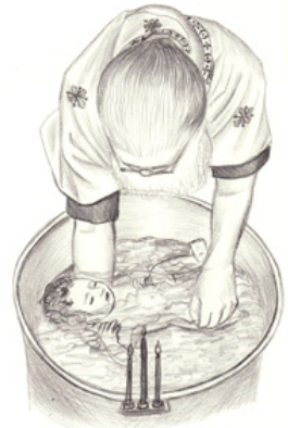
οἱ τρεῖς καταδύσεις τοῦ βρέφους

Ἡ εἰκονογράφηση τοῦ βιβλίου καθὼς καὶ ἡ παράθεση διηγήσεων ἀπὸ τὸ Γεροντικὸ καὶ τὰ Συναξάρια, στόχο ἔχουν νά διευκολύνουν τὸν ἀναγνώστη στήν προσέγγιση τοῦ Μυστηρίου.