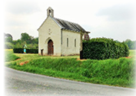
Ναὸς τῆς Ὁσίας Ραδεγονδίας. Σαίξ.

Ἀπέσπασε λοιπὸν τὴν συναίνεσι τοῦ Κλοταίρου γιὰ νὰ ἀφιερωθῆ ἐξ ὀλοκλήρου στὸν Θεό. Ἀπευθύνθηκε στὸν Ἅγιο Μεδάρδο († Μνήμη: 8ῆ Ἰουνίου), Ἐπίσκοπο τοῦ Νοβιομῶν (σημ. Νουαγιόν), ὁ ὁποῖος, ὅταν μετὰ τοὺς ἀρχικούς του ἐνδοιασμούς, ἠθέλησε νὰ τελέσῃ τὴν καθιέρωσί της, ἀπωθήθηκε ἀπὸ τὸ θυσιαστήριο ἀπὸ ἔμπιστους εὐγενεῖς τοῦ Βασιλέως, οἱ ὁποῖοι δὲν ἐπιθυμοῦσαν τὴν μοναχικὴ κουρὰ τῆς Βασιλίσσης.