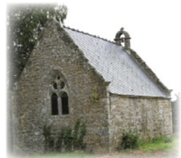
Ναοὶ τῆς Ὁσίας Ραδεγονδίας σὲ διάφορα μέρη τῆς Γαλλίας.