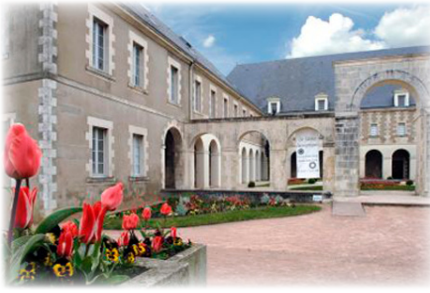
Μονή τῆς Θεοτόκου καὶ μετέπειτα τοῦ Τιμίου Σταυροῦ. Πουατιέ.

γόνατά μου, στὸ ἐξῆς θὰ ἔχης τὴν θέσι σου στὴν καρδιά μου».