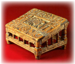
Τὸ Γραφεῖον τῆς Ὁσίας Ραδεγονδίας.

Ἀ ξιοπιούσα τὴν παρουσία τῶν Ἐπισκόπων, οἱ ὁποῖοι εἶχαν συγκεντρωθῆ στὴν Τουρώνη γιὰ μίαν Σύνοδο, ἡ Ὅσια Ραδεγονδία ἐζήτησε καὶ ἐπέτυχε γιὰ