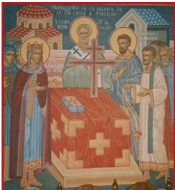
Τοιχογραφία ὑποδοχῆς ἱεροῦ τμήματος Τιμίου Σταυροῦ στὴν Μονή.