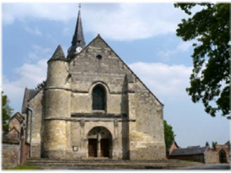
Ναός της Όσιας Ραδεγονδίας. Άτις.

ἐπαυλι τοῦ Ἄτις στὸ Βερμαντουά, στὴν Πικαρδία (Βορειοδυτικὴ Γαλατία), χάρις στὴν φροντίδα τῆς συζύγου τοῦ Κλοταίρου Ἰνγονδίας.