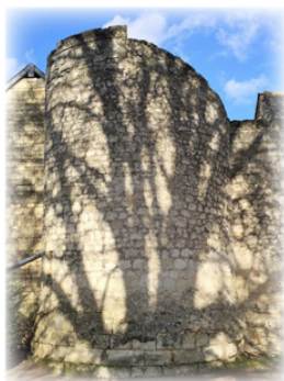
Ἐρείπια ἀπὸ τὴν ἔπαυλη στὸ Σαίξ.

Ἐνῶ ἀκολουθοῦσε τὴν θεάρεστη αὐτὴ πολιτεία, μία ἡμέρα εἶδε σὲ ὄραμα τὴν Ἐκκλησίαν τοῦ Χριστοῦ νὰ τῆς λέει: «Ὡς τώρα ἔμενες στὰ