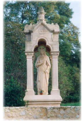
Προσκυνητᾶρι τῆς Ὁσίας Ραδεγονδίας.

Ἐχουσα λάβει ἐν ἀφθονία τὴν Χάρι τοῦ Ἁγίου Πνεύματος μὲ τίμημα τὸ οἰκειοθελὲς μαρτύριό της, ἡ Ἁγία Βασίλισσα διέδιδε Αὐτὴν γύρω της μὲ πλῆθος θαυμάτων. Ἐχάριζε τὸ φῶς στοὺς τυφλοὺς, ἐξεδίωκε δαιμόνια καὶ ἀρκοῦσε νὰ δοθῇ σὲ ἀσθενεῖς