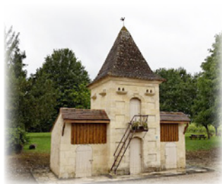
Ναοὶ τῆς Ὁσίας Ραδεγονδίας σὲ διάφορα μέρη τῆς Γαλλίας.

τι τὸν Χριστὸ στὸ πρόσωπο τῶν ζητιάνων, τῶν ὁποίων τὰ μέλη ἐνέδουε καὶ ἐθεωροῦσε ἀνώφελο γι' αὐτὴν κάθε ἀγαθό, τὸ ὁποῖο δὲν προσέφερε.