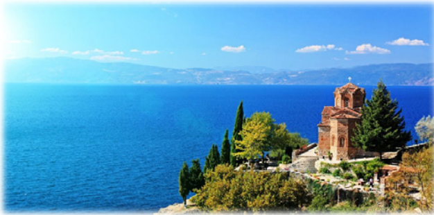
Λίμνη τῆς Ὀχρίδος.