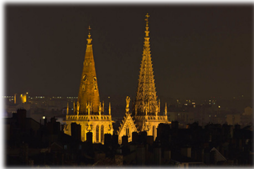
Ναὸς τοῦ Ἁγίου Νικήτιου.

Τῶ δὲ ἐν Τριάδι Παναγίῳ Θεῶ, τῶ ἐνδοξαζομένῳ ἐν τοῖς Ἁγίοις Αὐτοῦ, προσκύνησις καὶ εὐχαριστία, εἰς τοὺς αἰῶνας τῶν αἰώνων. Ἄμην!