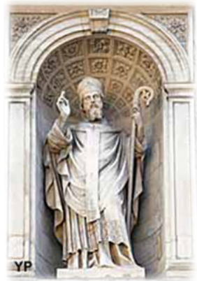
Ὁ Ἅγιος Νικήτιος.

Ἔ δειχνε ιδιαίτερη ἔγνοια γιὰ τὴν νεοελαία καὶ ἀνέτρεφε ὅλα τὰ παιδιά τῶν συγγενῶν καὶ ὑπηρετῶν του μὲ τὰνάματα τῆς Ἁγίας Γραφῆς καὶ ἰδίως τῶν Ψαλμῶν. Τ οὺς προέτρεπε νὰ ἀγαποῦν τὴν ἀγνότητα. Δ ιὰ μέσου τῆς ἁγίας αὐτῆς φροντίδος καὶ τῶν δραστηριοτήτων αὐτῶν ὁ ἅγιος Πρεσβύτερος Νικήτιος ἐτοιμάζετο γιὰ τὴν Ἀρχιερωσύνη.