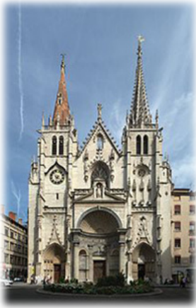
Ναός τοῦ Ἁγίου Νικητίου.

Ἐνεταφιάσθη στὸν ἱερὸ Ναὸ τῶν Ἁγίων Ἀποστόλων Πέτρου καὶ Παύλου καὶ τῶν 48 Μαρτύρων, τὸν ὁποῖον εἶχε ἀνεγείρει ὁ Ἅγιος Εὐχέρσιος († Μνήμη: 16 Νοεμβρίου 450) προκειμένου νὰ φυλάσσωνται ἐκεῖ τὰ ἅγια Λείψανα τῶν ἐνδόξων Μαρτύρων τοῦ Λουγδούνου, τῶν μαρτυρησάντων ἐν ἔτει 177.