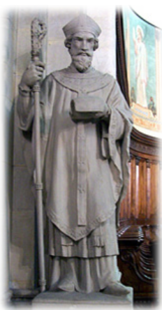
Ὁ Ἅγιος Σακερδὸς.

Κατὰ τὸ ἔτος 550, σὲ μία Σύνοδο στὸ Παρίσι, ὁ θεῖος του, Ἅγιος Σακερδὸς († Μνήμη: 12η Σεπτεμβρίου), Ἀρχιεπίσκοπος Λουγδούνου (νῦν Λυών), ἔπесе βαρεῖα ἄρρωστος. Ὁ Βασιλεὺς Χιλδεβέρτος ὁ Πρεσβύτερος – υἱὸς τοῦ Χλωδοβίκου καὶ τῆς Ἁγίας Κλοτίδης – ἤλθε νὰ τὸν ἐπισκεφθῆ καὶ ὁ Ἀρχιερεὺς τοῦ εἶπε: «Ζητῶ νὰ μὲ διαδεχθῆ ὡς Ἐπίσκοπος τοῦ Λουγδούνου ὁ Πρεσβύτερος Νικήτιος, ὁ ἀνηψιός μου. Δύναμαι νὰ δώσω μαρτυρία, ὅτι εἶναι ἀγνὸς καὶ σῶφρων, ὅτι ἀγαπᾷ τοὺς Ναοὺς τοῦ Χριστοῦ μας, ὅτι εἶναι φύσει ἐλεήμων, καὶ ὅτι γενικὰ ἐπιμελεῖται τόσο στὰ ἔργα του ὅσο καὶ στὸ ἦθος του νὰ ἐνεργῆ ὅπως ἀρμόζει στοὺς ἀληθινὸς δούλους τοῦ Θεοῦ».