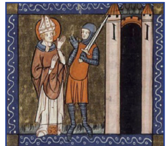
Ὁ Ἅγιος Εὐχέριος.

Τ έλος, ἀφοῦ ἐτακτοποίησε τὰ τῆς Μητροπόλεως καὶ συνέταξε τὴν Διαθήκην του, ἐκοιμήθη ἐν εἰρήνῃ σὲ ἡλικίαν ἐξήντα ἐτῶν, τὴν 2αν Ἀπριλίου 573.