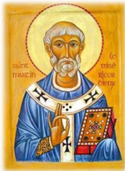
Ὁ Ἅγιος Μαρτῖνος τῆς Τουρώνης.