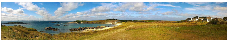
Ἡ Νῆσος Μπάτζ.

Δ ιέμειναν διαδοχικὰ σὲ διάφορα μέρη, τὰ ὁποῖα ὁ Παῦλος καθηγίαζε μὲ τὰ θαύματά του, καὶ τελικὰ ἐγκαταστάθηκαν στὴν χώρα τῆς Λεόν.