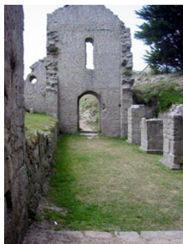
Καθεδρικός Ναός (αριστερά), Ὡμοφόριο τοῦ Ἁγίου (μέσο), εῤείπια στὴν τοποθεσία τῆς Μονῆς στὴν Νῆσο Μπάτζ (δεξιά).

γιὰ τὴν ἐρημικὴ ζωὴ. Ἡ δὲ ἀγνὴ ψυχὴ του εἴλκυσε πλουσίως τὴν Χάρι τοῦ Θεοῦ, ἡ Ὅποια ἐνεργοῦσε θαύματα διὰ μέσου τοῦ νεωτάτου μαθητοῦ Αὐτοῦ.