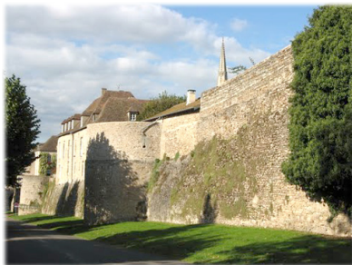
Ἡ Μονὴ τοῦ Ἁγίου Συμφοριανοῦ.