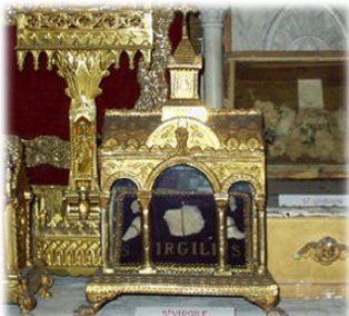
Ἡ Ἱερὰ Λάνρακα τοῦ Ὁσίου Βιργιλίου.