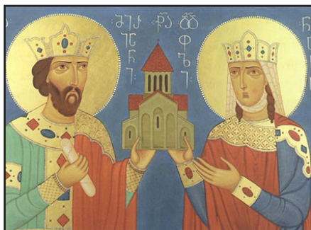
Οἱ Ἅγιοι Βασιλεῖς Μιριάν καὶ Νάνα.