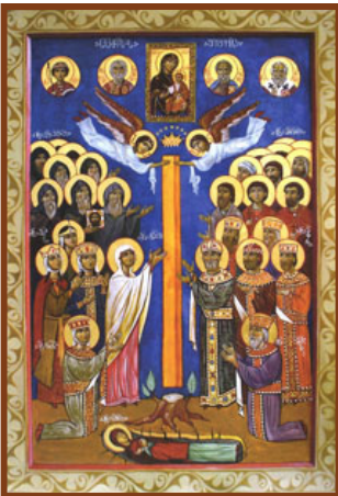
Οἱ Ἄγιοι τῆς Γεωργίας.