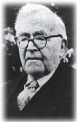
Κάρλ Μπάρτ (1886-1968)