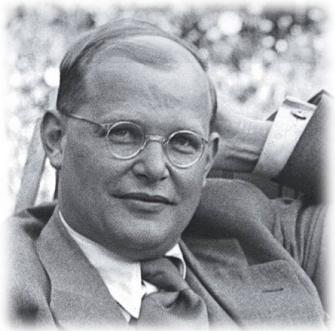
Ντίτριχ Μπονχέφερ (1906-1945)

«Εἶναι τραγικό κάποιος Χριστιανός νά ὑποστηρίξη ναζιστικές ἀπόψεις...»