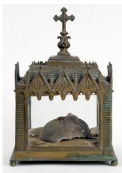
Τμήμα τῆς ἁγίας Κράας καὶ ἄλλα Λείψανα τοῦ Ὁσίου Ἰωάννου.