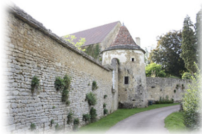
Τὰ τεῖχη τῆς Μονῆς τοῦ Ρεομέ.