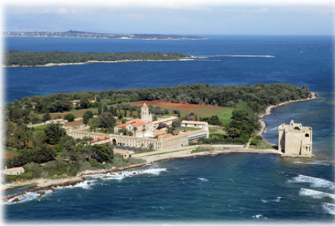
Ἡ Μονὴ τοῦ Λερίνου (Λερίνς).

τέχνη αὐτῆ τῶν τεχνῶν καὶ ἐπιστήμῃ τῶν ἐπιστημῶν.