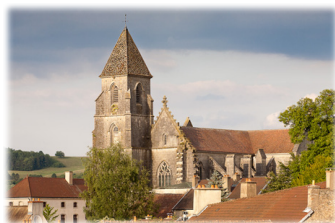
Ἡ Μονὴ τοῦ Ὁσίου Σίγο ἢ Σέν.

Ἐνταφιάσθηκε στὴν Μονὴ τοῦ Ρεομέ, ἡ ὁποία ἐπωνομάσθηκε ἀργότερα Μουτιέ Σαιν Ζαν (Μονὴ Ἁγίου Ἰωάννου), ἀλλὰ κατεδαφίσθηκε κατὰ τὴν Γαλλικὴ Ἐπανάστασι τὸ 1792.