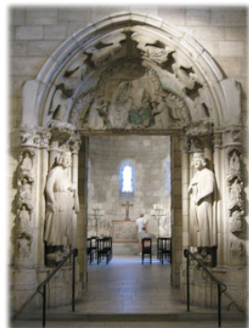
Πύλη τῆς Μονῆς τοῦ Ρεομέ.

Ὁ Ὁσιος Ἰωάννης ἐδέχετο αὐτοῦς, ἀλλὰ συναισθανόμενος τὴν ἀδυναμίαν του, ἐπισκέ-