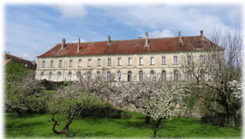
Ἡ Μονὴ τοῦ Ρεομέ.