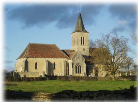
Ὁ Ναὸς τοῦ Ἁγίου Παύλου στὸ Ρεομέ, ὅπου φυλάσσεται ἓνα μέρος τῶν ἁγίων Λειψάνων τοῦ Ὀσίου Ἰωάννου.