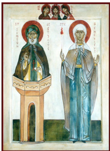
Ὁ Ὅσιος Συμεὼν ὁ Στυλίτης καὶ ἡ Ὁσία Γενεβιέβη.

Συντόμως ὁ Ναὸς ἐκτίσθη καὶ ἡ εὐλογημένη Γενεβιέβη μετέβαινε ἐκεῖ τακτικῶς γιὰ νὰ προσευχηθῆ, ἰδίως τὶς Κυριακές, καὶ ἠγρύπνει ὀλονυκτίως.