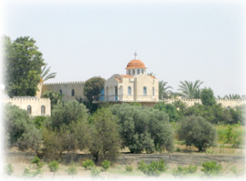
Ἱερά Μονή Μεταμορφώσεως τοῦ Σωτήρος.

2. Ἐν συνεχείᾳ, μεταβήκαμε στήν πλησιόχωρη Γυναικεία Μονή τῆς Μεταμορφώσεως (Καθηγουμένη Γερόντισσα Λαμπαδία, Ὑπεύθυνη Γερόντισσα Συγκλητική –ἀδελφή τοῦ Μητροπολίτου Σεβαστιανοῦ), μᾶς ὑπεδέχθησαν μέ ἀγάπη καί εὐγένεια, προσεκυνήσαμε καί μᾶς παρετέθη πολὺ περιποιημένο με-