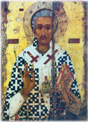
Ὁ Ἅγιος Λάζαρος.