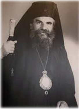
Ὁ Κιτίου Ἐπιφάνιος († 2005).