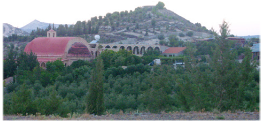
Ἡ Ἱερὰ Μονὴ τοῦ Ἁγίου Ἐπιφανίου Κύπρου.

1. Τὶς πρωϊνὲς ὥρες ἔγινε μία σύντομος ἐπίσκεψις στὴν οἰκία τοῦ Χριστοῦ καὶ τῆς Εὐρυδίκης, ὅπου συναντήσαμε μερικὰ ἀπὸ τὰ τέκνα τῆς πολυμελοῦς καὶ εὐλογημένης αὐτῆς οἰκογενείας καὶ μερικοὺς συγγενεῖς τους.