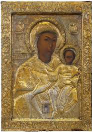
Ἱερὰ Εἰκὼν Παναγίας Φανερωμένης.