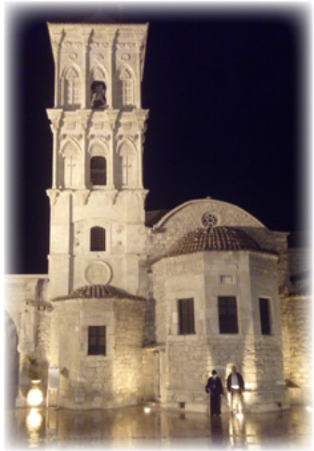
Ὁ Ἱερὸς Ναὸς τοῦ Ἁγίου Λαζάρου τοῦ Τετραημέρου.

2. Ἐπιστρέψαμε στὸ κατάλυμά μας κατὰ τις 4:30' μ.μ. μὲ συναισθήματα εὐγνωμοσύνης πρὸς τὸν Θεῖον Δομῆτορα τῆς Ἐκκλησίας γιὰ τὸ Θαῦμα, τὸ Ὅποιο εἶχαμε βιώσει καὶ εἶχε πολλαπλές καὶ πολύμορφες ἐκφράσεις Οἰκοδομῆς καὶ Παραμυθίας ἐν Χριστῷ, μάλιστα δὲ καὶ κατ' ἐξαιρέσιν στήν προ-