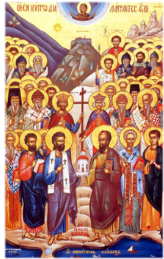
Οἱ Ἅγιοι τῆς Κυπrou.

Τ ώρα, θὰ εἶχα τὴν ἰδιαιτέρη χαρὰ νὰ γνωρισθῶ με ἀρκετοὺς πλέον Ἀρχιερεῖς τῆς Ἱερᾶς αὐτῆς Συνόδου, νὰ βιώσω τὴν ἀδελφικὴ προσέγγισι βαθύτερα, νὰ συμπροσευχηθῶ καὶ νὰ συγχαρῶ μαζί τους γιὰ τὴν προαγωγή τοῦ ἐναρέτου καὶ τόσο εὐλογημένου π. Ἐπιφανίου στὸ ὕψος τῆς Ἀρχιερωσύνης, τέλος δὲ νὰ συμβάλω –βοηθεία τῆς Θεοτόκου– στὴν διεύρυνσι τῆς ὁδοῦ πρὸς τὴν ποθητὴ Ἐνωσι καὶ Εὐχαριστιακὴ Κοινωνία τῶν δύο Συνόδων μας.