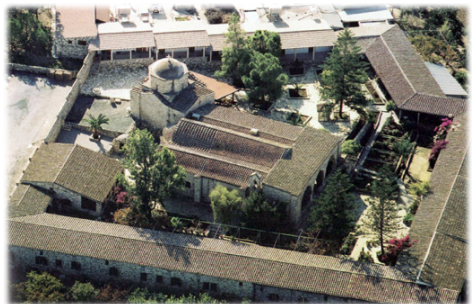
Ἡ Ἱερὰ Μονὴ τοῦ Ἁγίου Ἡρακλείδιου.

Ὁ θαυμάσιος καὶ ἐπίσης ἀρχαιότατος μεγάλος Ναός, περιλαμβάνον καὶ τὸ Μαρτύριον, ὡς καὶ τὸ ὅλο κτιριακὸ συγκρότημα τῆς Ἱερᾶς Μονῆς, τὸ ὁποῖο φιλοξενεῖ μίαν 40μελῆ Ἀδελφότητα Μοναστριῶν, ἀποπνέει καὶ μαρτυρεῖ τὴν ἀρχαιοπρεπῆ λαμπρότητα, συνταιριασμένη μὲ τὴν λιτότητα καὶ σε-