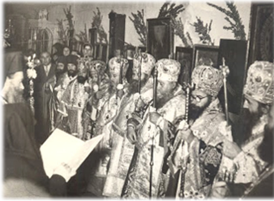
Τὸ 1956 ἔχειροτονήθη ὁ Κιτίου Ἐπιφάνιος, ἕβδομος ἐκ δεξιῶν.

στό Γυναικεῖο Μοναστήρι τῆς Μεταμορφώσεως τοῦ Κυρίου, στό Ἀβδελλερό. Ἡ Χειροτονία θὰ ἐτελεῖτο ἐδῶ.