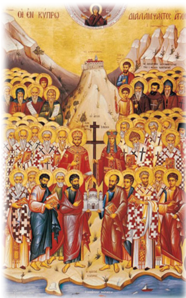
Οἱ Ἅγιοι τῆς Κύπρου.

Ἐξεδόθη ἡ ἀπὸ πολλοῦ ἀναμενομένη τελικὴ Δικαστικὴ Απόφασις (Ἀριθμ. Ἀγωγῆς 2046/2011) ἀπὸ τὸ Ἐπαρχιακὸ Δικαστήριον Λάρνακας ἐπὶ τῶν παραλόγων διεκδικήσεων τῶν σχισματικῶν τοῦ Ρουμάνου Παρθενίου ἔναντι τοῦ Σεβασμ. κ. Σεβαστιανοῦ (ὅτι δῆθεν δὲν εἶναι ὁ Κανονικὸς Μητροπολίτης Κιτίου), ἔναντι τῆς Ἱερᾶς Μονῆς Μεταμορφώσεως (ὅτι δῆθεν δὲν ἀνήκει στὴν ἐγκαταβιοῦσα ἐκεῖ Ἀδελφότητα ὑπὸ τὴν Κα-