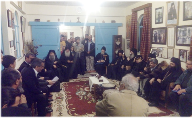
Στὸ Ἀρχονταρίκι τῆς Ἱεράς Μονῆς Μεταμορφώσεως, μετὰ τὴν Δοξολογία γιὰ τὴν Δικαστικὴ Ἀπόφασι.