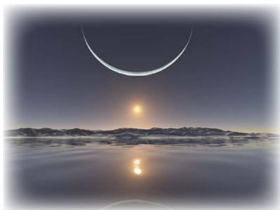
“Ἡλιος τοῦ μεσονυκτίου στὸν Βόρειο Πόλο

νήσεις, οἱ συγκεκριμένες ἡμερο- μηνίες ἔχουν ξεχωριστὴ σημασία καὶ εἶναι ἡμέρες εἰδικῶν λατρευ- τικῶν καὶ τελετουργικῶν ἐκδη- λώσεων.