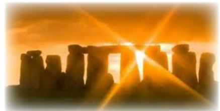
Θερινὸ ἡλιοστάσιο 2014

Σὲ πολλὲς νεότερες παγανιστικὲς καὶ ἀποκρυφιστικὲς κι-