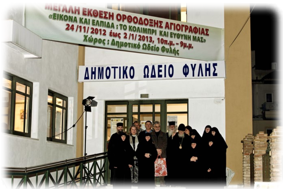
Άναμνηστικές φωτογραφίες στην είσοδο του Ωδείου Φυλής, όπου φιλοξενείται η Έκθεση Άγιογραφίας.