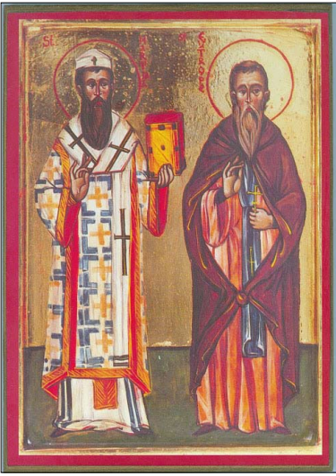
Ο Άγιος Εὐτρόπιος, δεξιά, με τὸν Άγιο Μαρτιάλη, πρῶτο Ἐπίσκοπο τοῦ Λιμῶς [30ῆ Ἰουνίου].

ἄρχισε τότε νὰ ἐπισκέπτεται συχνότερα τὴν πόλη, ἀκολουθούμενος πλέον ἀπὸ μεγάλο πλῆθος κόσμου ποὺ τὸν ἀποκαλοῦσε «Ἀπεσταλμένο Θεοῦ».