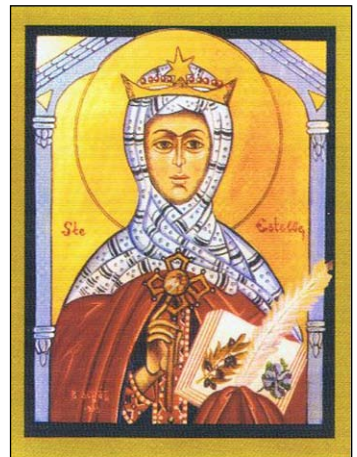
Ἡ Ἁγία Εὐστέλλα. Ἡ ἱερὰ μνήμη αὐτῆς ἐορτάζεται ὁμοῦ με τὸν Ἁγιο Εὐτρόπιο τὴν 30ῆ Ἀπριλίου**.

Ὁ τάφος τοῦ Ἁγίου Εὐτροπίου λησμονήθηκε μέχρι τὸν 5' αἰῶνα, ἐποχὴ κατὰ τὴν ὁποία δύο Μοναχοὶ βρῆκαν τὰ τίμια Λείψανα αὐτοῦ. Τὸ ἔτος 590, ὁ τότε Ἐπίσκοπος τῆς πόλεως Παλλάδιος κατέθεσε πανηγυρικῶς αὐτὰ στὴν Βασιλική, ἡ ὁποία κτίστηκε πρὸς τιμὴν τοῦ Ἁγίου.