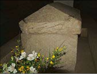
Ὁ τάφος τοῦ Ἁγίου Εὐτροπίου στήν Κρύπη τῆς ὁμωνύμου Βασιλικῆς.

(**) Κατὰ ἄλλες πηγές ἡ μνήμη τῆς Ἁγίας Εὐστέλλας ἐορτάζεται τὴν 11ῃ ἢ 24ῃ Μαΐου.