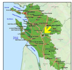
Ἡ πόλις Σαιντ τοῦ Σαιντόνζ τῆς σημερινῆς Γαλλίας