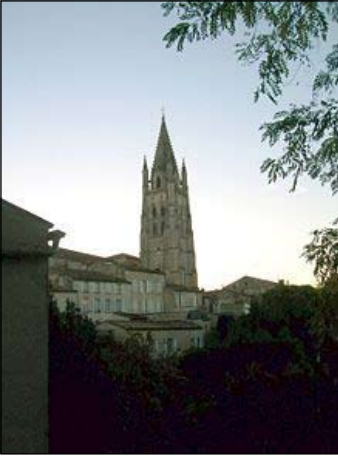
Ἡ Βασιλική τοῦ Ἁγίου Εὐτροπίου στήν Σαίντ τῆς Γαλλίας

Ὁ τάφος τοῦ Ἁγίου Εὐτροπίου κατέστη μέγα Προσκύνημα, ὅπου ἐπιτελοῦνταν πολυάριθμα θαύματα καί ἦταν σταθμὸς στήν διαδρομὴ τοῦ Προσκυνηματος τοῦ Ἁγίου Ἰακώβου τῆς Κομποστέλλας (Ἰσπανία).