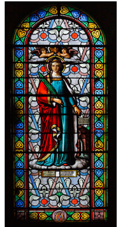
Παράθυρα τῆς Βασιλικῆς μὲ εἰκονίσματα (βιτρώ) τῶν Ἁγίων Εὐτροπίου καὶ Εὐστέλλας.