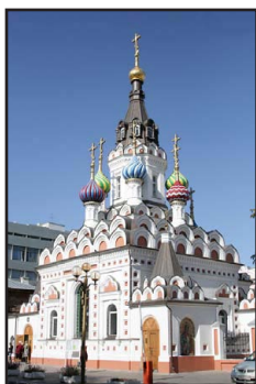
Ὁ Ἱερός Ναός τῆς Παναγίας «Καταπράϋνον τὴν Θλίψιν μου», στὸ Σαράτωβ Ρωσίας.

ὁποία ζητοῦσε. Τ ότε ὁ Ἱερεὺς ἄρχισε νὰ κατεβάζη τὶς παλαιῆς Εἰκόνες, οἱ ὁποῖες ἦσαν στὸ κωδωνοστάσιο. Π ράγματι, σὲ μία ἀπὸ αὐτὲς ὑπῆρχε ἡ ἐπιγραφή «Καταπράϋνον τὴν Θλίψιν μου».