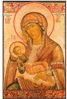
Ἱερὰ Εἰκὼν τῆς Παναγίας «Καταπράϋνον τὴν Θλίψιν μου», Β. Ρωσία, πρῶτον ἡμῖσι τοῦ ΙΖ' αἰ.

Ἡ ἀσθενῆς κυρία πράγματι μεταφέρθηκε στὴν Μόσχα στὸν εἰρημένο Ναὸ τοῦ Ἁγίου Νικολάου, ἀλλὰ δὲν εὐρήκε τὴν Εἰκόνα, τὴν