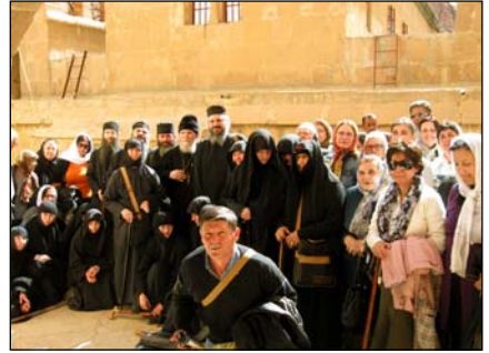
Στήν Ἱερά Μονή τοῦ Σινᾶ.

Ἐπιστρέψαμε ἀπὸ τὸν ἴδιο δρόμο ποὺ εἶχαμε ἔλθει καὶ καταλήξαμε ὅταν πλέον νύκτωσε στήν Ἱερουσαλήμ, στοῦ ἐκτὸς τῶν τειχῶν τῆς Παλαιᾶς Πόλεως Ξενοδοχεῖο «Ἡ Ἁγία Γῆ», ὅπου καὶ θὰ διαμείναμε τὶς ὑπόλοιπες ἡμέρες τοῦ Προσκυνηματός μας.