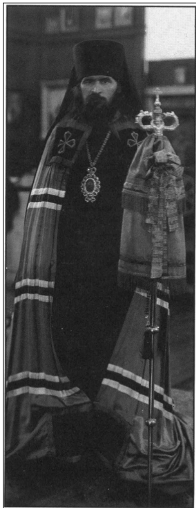
Ὁ Ἅγιος Ἰωάννης ἅμα τῇ ἀφίξει του ὡς Ἐπισκόπου στὴν Σαγγάν τῆς Κίνας τὸν Νοέμβριο τοῦ 1934.

Ἄν τὰ καθήκοντα ἐνὸς συνήθους ποιμένος εἶναι τόσο δύσκολα καὶ περίπλοκα, καὶ ἡ ὑπευθυνότητά του γιὰ τὴν σωτηρία τοῦ ποιμνίου του τόσο μεγάλη, τότε τί μπορούμε νὰ εἰποῦμε γιὰ τὸν ἀρχιποιμένα! Πράγματι, ὁ Κύριος σ' αὐτὸν ὁμιλεῖ ὅταν λέγῃ ἐκ προοιμίου στὸν Προφήτη Ἰεζεκιήλ: Υἱὲ