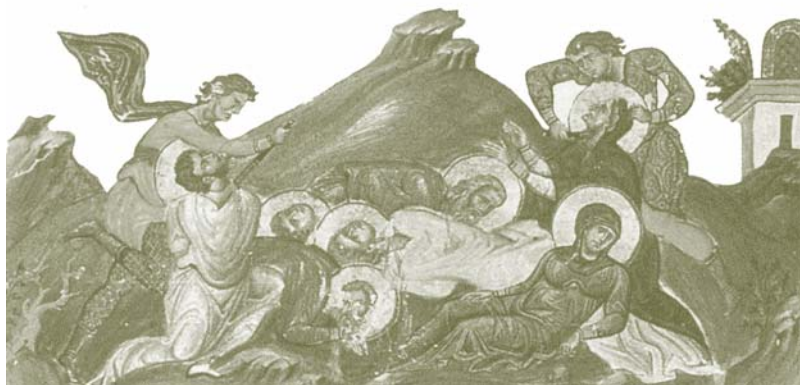
Μαρτύριον τῆς Ἁγίας Περπετούας καὶ τῶν σὺν αὐτῇ. Μικρογραφία ἐκ τοῦ Βασιλειανοῦ Μηνολογίου (I' αἰ.).

μᾶς ρίξουν σ' αὐτὴ τὴ δάμαλη ποῦ λένε;». Καὶ ὅταν ἄκουσε ὅτι εἶχε ἤδη βγεῖ ἐναντίον της, δὲν τὸ πίστεψε μέχρι ποῦ εἶδε τὰ σημάδια τῆς πληγῆς στὸ σῶμα της. Φώναξε τὸν ἀδελφὸ της, ποῦ ἦταν κι αὐτὸς κατηχούμενος, καὶ τοὺς παρακαλοῦσε νὰ παραμείνουν πιστοὶ καὶ νὰ ἀγαποῦν ὁ ἓνας τὸν ἄλλο καὶ νὰ μὴ σκανδαλιστοῦν ἀπὸ ἐκεῖνα τὰ μαρτύρια.