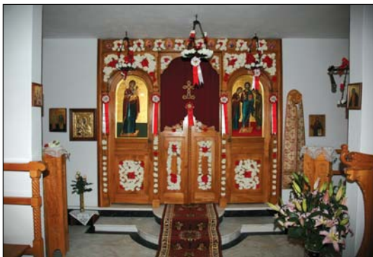
Ἱερόν Ναῦδοιον Παναγίας Πορταΐτισσης Φυλῆς Ἀττικῆς.