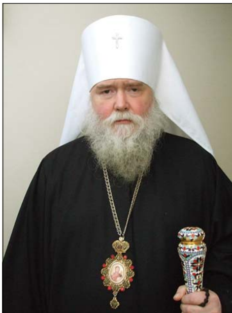
Ὁ Σεβ. Μητροπολίτης κ. Ἀγαθάγγελος, Πρωθιεράρχης τῆς Ρ.Ο.Ε.Δ.