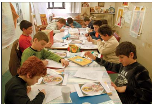
Οἱ μικροὶ μαθηταὶ τοῦ Ἀγιογραφείου τῆς Ἱερᾶς Μονῆς τῶν Ἁγίων Κυπριανοῦ καὶ Ἰουστίνης Φυλῆς Ἀττικῆς.