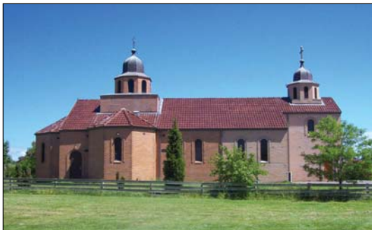
Ἱερός Ναός Ἁγίου Στεφάνου Ντέτσανι εἰς Μελβούρνην Αὐστραλίας.