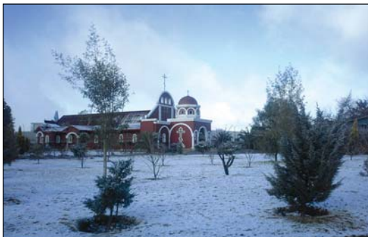
Ἱερός Ναός Ἁγίου Σεραφεῖμ τοῦ Σάρωφ εἰς Γιοχάννεσμπουργκ Νοτίου Ἀφρικής.