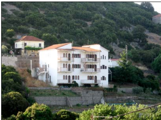
Ἱερὸν Ἡσυχαστήριον Ἁγίου Χριστοφόρου εἰς Χρυσοβίτσαν Θέρμον Αἰτωλοακαρνανίας.