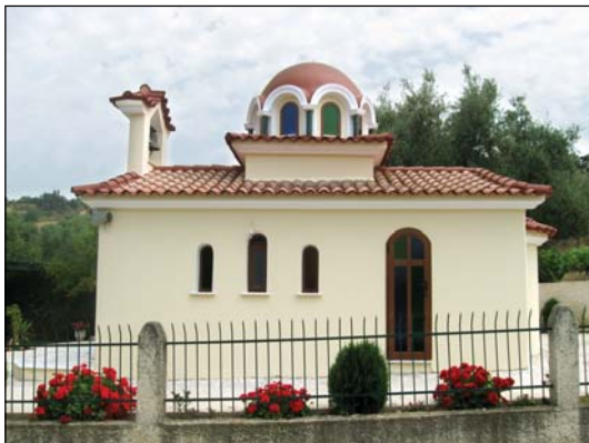
Ἱερόν Ναῦδριον Ἁγίου Γεωργίου εἰς Ροῦτικα Πατρῶν Ἀχαΐας.