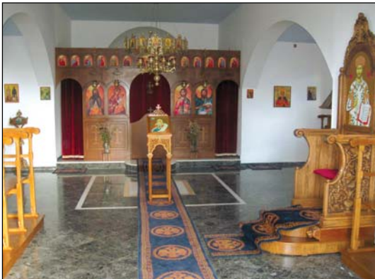
Ἱερά Μονή Προφήτου Ἡλιοῦ, εἰς Μηλιῆς Λάλα Ἡλείας.