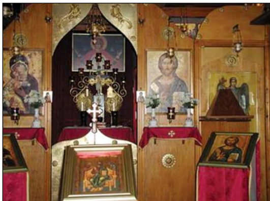
Ἱερός Ναός Ἁγίων Κυπριανοῦ καὶ Ἰουστίνης εἰς Κάλιαρι Σαρδινίας.