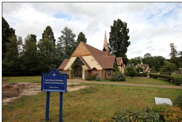
Ἱερὰ Μονὴ τοῦ Ἁγίου Βασιλομάργουρος Ἐδουάρδου Ἀγγλίας.