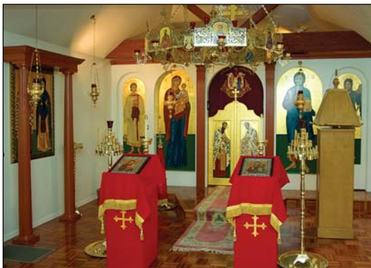
Ἱ. Ναὸς Ἀγίων Κυπριανοῦ καὶ Ἰουστίνης Ἔτνα Καλιφορνίας.