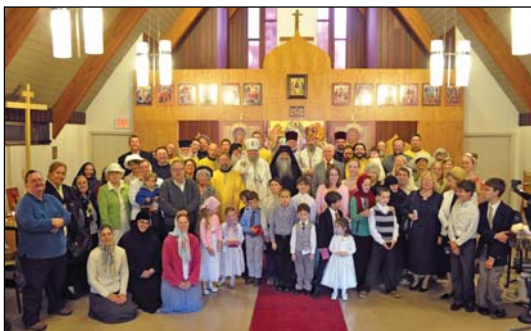
Ἱερὸς Ναὸς Ἀναλήψεως τοῦ Σωτῆρος εἰς Ρότσεστερ Ν. Ὑόρκης.