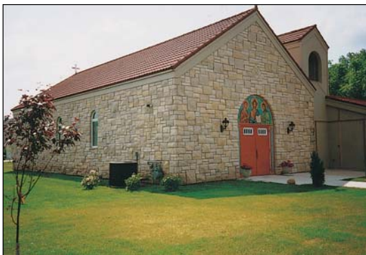
Ἱερὸς Ναὸς Τιμίου Προδρόμου εἰς Ἀϊόβα τῶν Η.Π.Α.