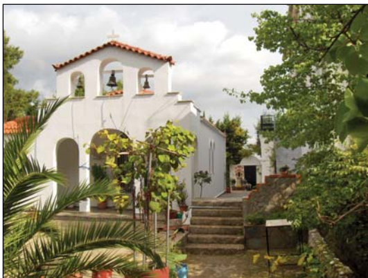
Τερά Μονή Παναγίας Μυρτιδιωτίσσης Ἀφιδνῶν Ἀττικῆς.