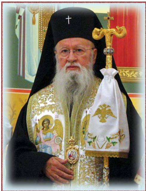
Ὁ Σεβασμιώτατος Μητροπολίτης † Ὁρωποῦ καὶ Φυλῆς κ. Κυπριανὸς Πρόεδρος τῆς Ἱερᾶς Συνόδου τῶν Ἐνισταμένων