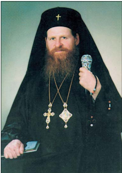
Ὁ Σεβασμ. Μητροπολίτης κ. Βλάσιος