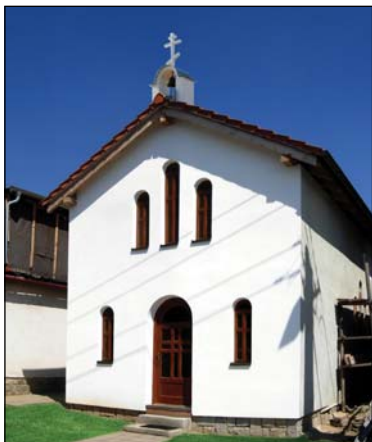
Ἱερός Ναός Ἁγίου Ἰωάννου Μαξίμοβιτς εἰς Γιεζντόβιτσε Τσεχίας.