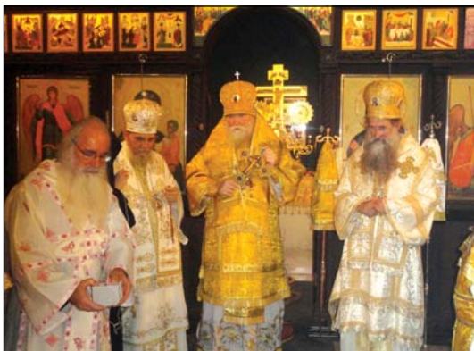
Λειτουργικός Συνεορτασμός τῶν Ἑλλήνων Ὁρθοδόξων Ἐνισταμένων μετὰ τοῦ Μητρο. Ἀγαθαγγέλου τῆς Ἀδελφῆς ΡΟΕΔ εἰς Ὁδησὸν τῆς Οὐκρανίας τὸν Αὐγούστον τοῦ 2010.