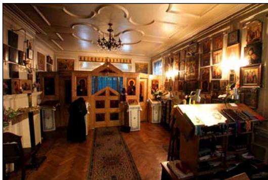
Ἱερὰ Γυναικεῖα Μονὴ Εὐαγγελισμοῦ τῆς Θεοτόκου Λονδίνου.