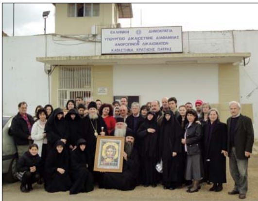
Ἀπὸ τὰς Ἐπισκέψεις Ἀγάπης εἰς Φυλακὰς.