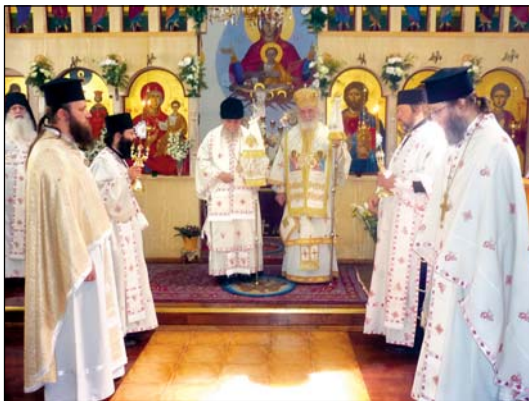
Θεία Λειτουργία εἰς τὸν Ἱερὸν Ναὸν τῶν Ἁγίων Κωνσταντίνου καὶ Ἑλένης εἰς Βάμπεργκ Στοκχόλμης Σουηδίας, Μάϊος 2010.