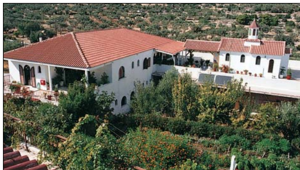
«Οἶκος Ἁγίου Ἰωσήφ» Φυλῆς Ἀττικῆς.