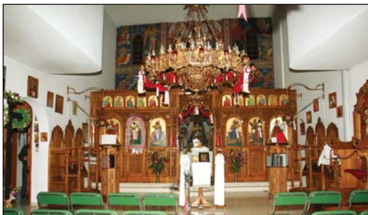
Τερός Ναός Εὐαγγελισμοῦ τῆς Θεοτόκου, ἐντὸς τοῦ ὁμωνύμου Πνευματικοῦ Κέντρου εἰς Κολωνὸν Ἀθηνῶν.