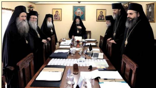
Συνεδρίασις τῆς Ἱερᾶς Συνόδου τῶν Ἐνισταμένων (Ὀκτώβριος 2010).