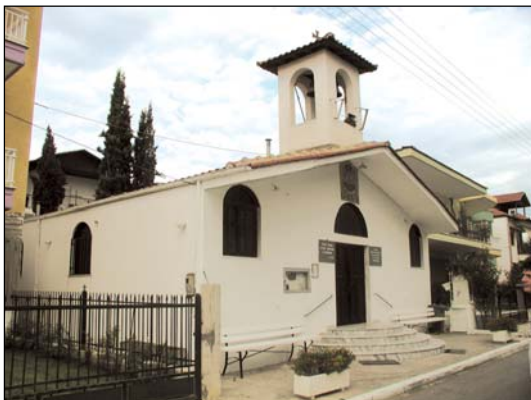
Ἱερός Ναός Ἁγίων Πάντων Κατερίνης.