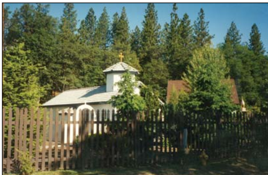
Ἱερά Ἀνδρώα Μονή Ἀγίου Γρηγορίου Παλαμᾶ εἰς Ἑτνα Καλιφορνίας τῶν Η.Π.Α.