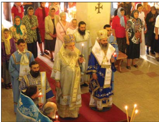
Ἐκ τῆς Πανήγυριν τῆς Κοιμήσεως τῆς Θεοτόκου εἰς Σόφιαν Βουλγαρίας, 15.8.2010 ἐκ.ἡμ.