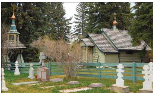
Ἱερὰ Μονή Ἀγίας Σκέπης εἰς Μπλάφτον τοῦ Καναδά.