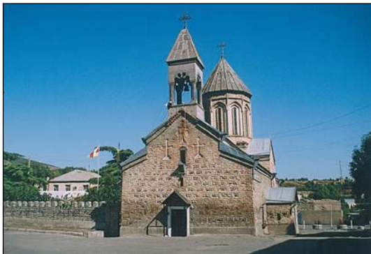
Ἱερός Καθεδρικός Ναός Γενεθλίου τῆς Θεοτόκου εἰς Τσίνβαλι τῆς Νοτίου Ὀσσετίας.