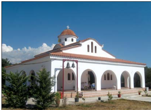
Ἱερὸς Ναὸς Παναγίας Γιάτρισσας εἰς Ἀσπρόχωμα Καλαμάτας.