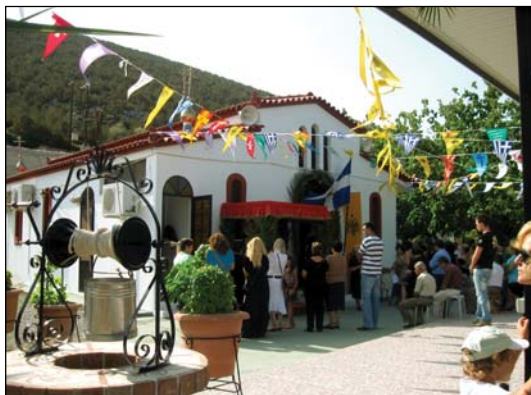
Ἱερὸν Ἡουχαστήριον Ὁσίας Εἰρήνης Χρυσοβαλάντου εἰς Βατώντα Νέας Ἀρτάκης Εὐβοίας.