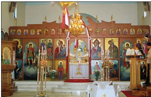
Ἱερὸς Ναὸς Ἁγίων Ἀναργύρων εἰς Σύδνεϋ Αὐστραλίας.