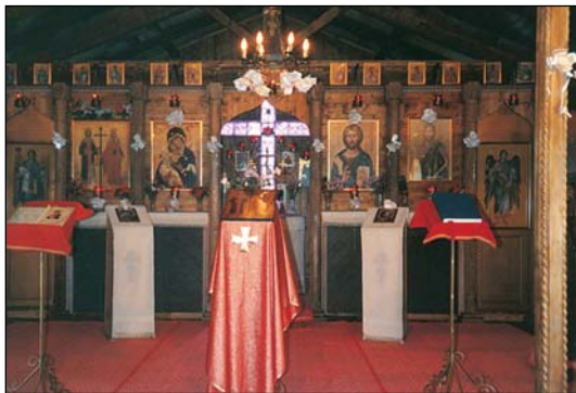
Ἱερός Ναός Ἁγίων Κωνσταντίνου καὶ Ἑλένης εἰς Μπουρτσέϊ Σαρδινίας.