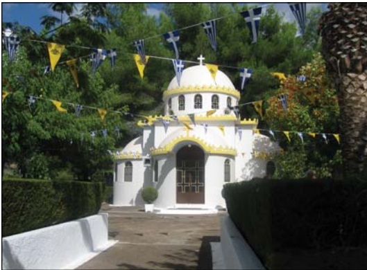
Ἱερόν Ἐσυχαστήριον Ἁγίων Κυπριανοῦ καὶ Ἰουστίνης Πύργου Ἡλείας.