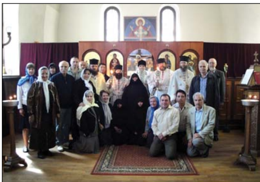
Ἱερὸς Ναὸς Κοιμήσεως τῆς Θεοτόκου εἰς Οὐψάλαν Σουηδίας.