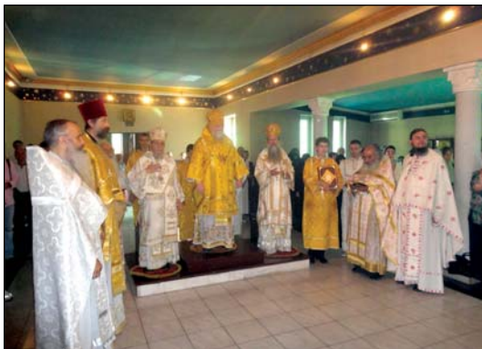
Συλλειτουργία μετὰ τῶν Ἀδελφῶν τῆς Ρωσικῆς Διασπορᾶς εἰς Ὀδησοῦν Οὐκρανίας (2.8.2010) καὶ τῆς Ἐκκλησίας τοῦ Πατρίου Ἡμερολογίου Ρουμανίας εἰς Σλατιοάραν (6.8.2010).