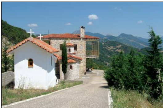
Ἱερὸν Ἡσυχαστήριον Ἁγίας Παρασκευῆς εἰς Ρόγγια Χρυσοβίτσης Θέρμον Αἰτωλοακαρνανίας.