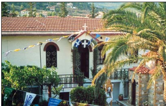
Ἱερὰ Μονὴ Ἁγίας Παρασκευῆς Ἀχαρνῶν Ἀττικῆς.