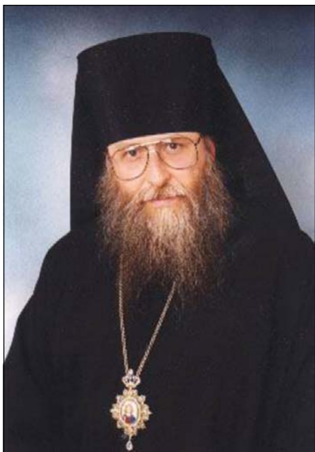
Ὁ Σεβασμ. Ἐπίσκοπος Τριάδιτσα κ. Φώτιος