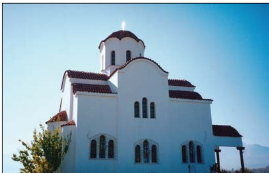
Ἱερόν Ἐνοχαστήριον Μεταμορφώσεως τοῦ Σωτῆρος Νεοκαισαρείας Πιερίας.