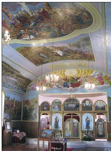
Ἱερὸς Ναὸς Ἁγίου Γεωργίου Τροπαιοφόρου εἰς Κανμπέρραν Αὐστραλίας.