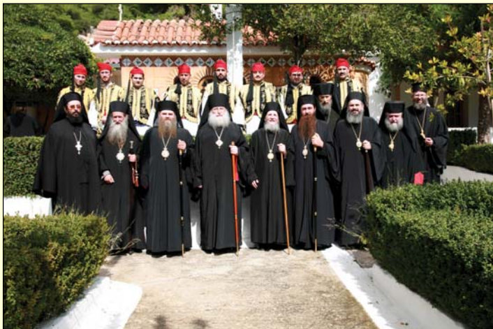
Ἄπο τὴν Πανήγυριν τῆς Ἱερᾶς Μονῆς τῶν Ἁγίων Κυπριανοῦ καὶ Ἰουστίνης φυλῆς Ἀττικῆς, 2.10.2010.