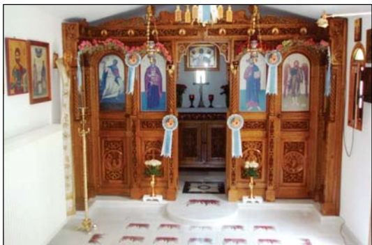
Ἱερός Ναός Προφήτου Ἡλία Αὐλίδος.