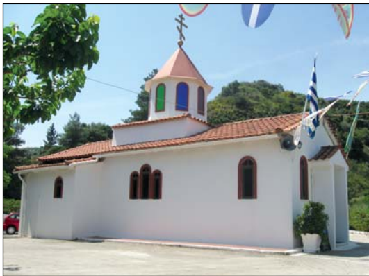
Ἱερός Ναός Ἀναλήψεως τοῦ Σωτῆρος Ἀνθουπόλεως Πατρῶν.