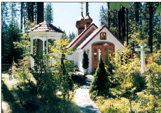
Ἱερά Μονή Ἀγίας Νεομάρτυρος Ἐλισάβετ εἰς Ἑτνα Καλιφορνίας τῶν Η.Π.Α.