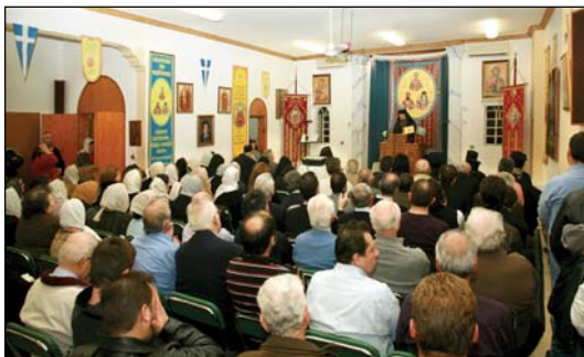
«Σύναξις Ὁρθοδόξου Ἐνημερώσεως» Κυριακὴ τῆς Ὁρθοδοξίας 2010 εἰς τὴν Αἴθουσαν Ὁμιλιῶν τοῦ Πνευματικοῦ Κέντρου εἰς Κολωνὸν Ἀθηνῶν.