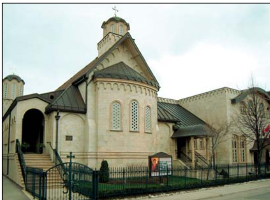
Ἱερός Ναός Ἀρχαγγέλου Μιχαὴλ εἰς Τορόντο τοῦ Καναδά.