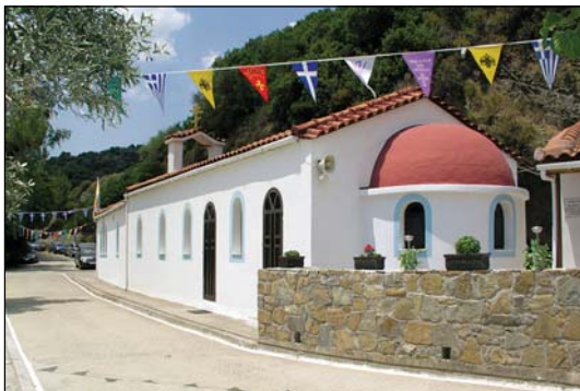
Ἱερὸν Ἡουχαστήριον Ἁγίων Πάντων εἰς Σφουρεῖκα Ἀγρινίου.