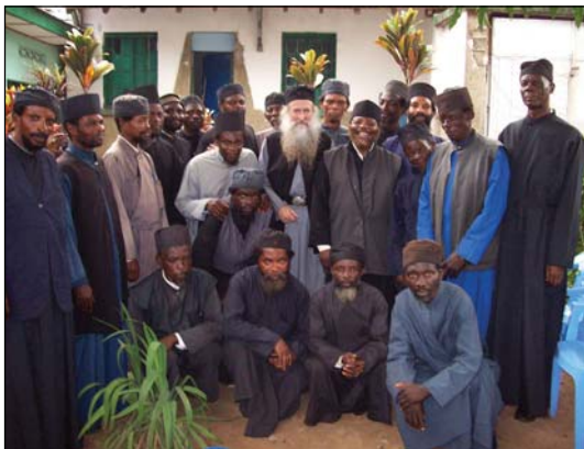
Τεραποστολή εἰς Κονγκό.