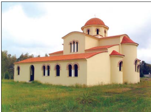
Ἀνεγειρομένη Ἱ. Μονή Ἁγίου Ἀντωνίου Μαρροῦμπιου Σαρδινίας.