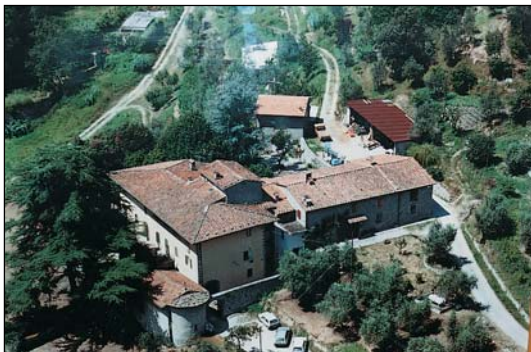
Ἱερὰ Μονὴ Ὁσίου Σεραφεῖμ τοῦ Σάρωφ Πιστόϊα Ἰταλίας.