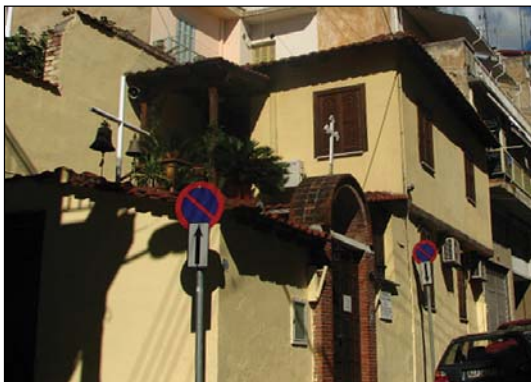
Ἱερόν Μετόχιον Ἁγίου Ἰωάννου Ἐλεήμονος Θεσσαλονίκης.