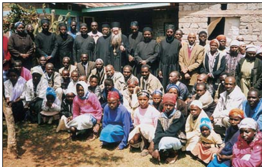
Ὁρθόδοξος Ἱεραποστολή εἰς Κένυαν.