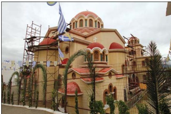
Ἐξωτερικὴ καὶ ἐσωτερικὴ ἄποψις τοῦ Προσκνηματικοῦ Ναοῦ τῆς Ἱερᾶς Μονῆς τῶν Ἁγίων Κυριανοῦ καὶ Ἰουστίνης Φυλῆς.