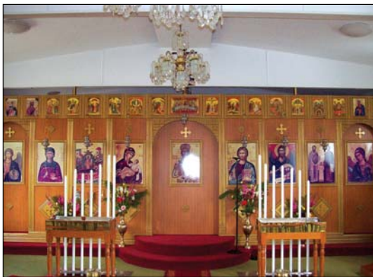
Ἱερός Ναός Κοιμήσεως τῆς Θεοτόκου εἰς Μελβούρνην Αὐστραλίας.