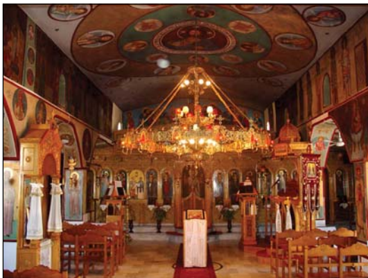
Ἱερός Ναός Ἀγίων Ἀναργύρων Ἐλευσίνος Ἀττικῆς.