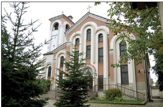
Ἱερός Καθεδρικός Ναός Κοιμήσεως τῆς Θεοτόκου εἰς Σόφιαν Βουλγαρίας.