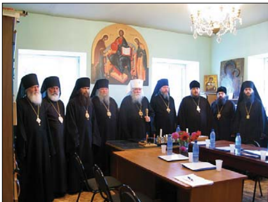
Ἡ Ἱερὰ Σύνοδος τῆς Ἱεραρχίας τῆς ΡΟΕΔ κατὰ τὴν σύγκλησιν Αὐτῆς τὸν Σεπτέμβριον τοῦ 2010.