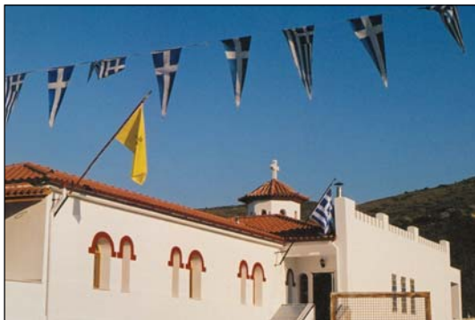
Ἱερὸν Ἡουχαστήριον Μεταμορφώσεως τοῦ Σωτῆρος εἰς Συκάμινον Ἀττικῆς.