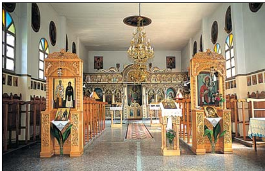
Ἱερός Ναός Ἁγίων ἸΒ' Ἀποστόλων Κυμίνων Θεσσαλονίκης.