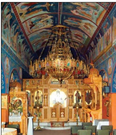
Ἱερὰ Μονὴ Παναγίας Μυρτιδιωτίσσης Ἀμυγδαλέζας Σταμάτας Ἀττικῆς.