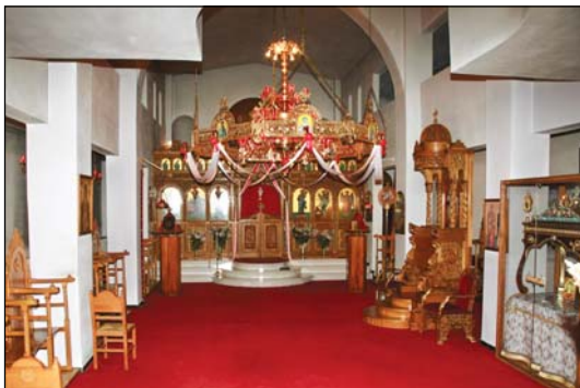
Ἱερός Ναός Ὁσίας Ξένης Ρωσίδος Ὁρωποῦ Ἀττικῆς.