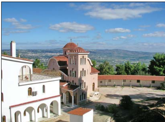
Τερά Μονή Ἁγίων Ἀγγέλων Ἀφιδνῶν Ἀττικῆς.