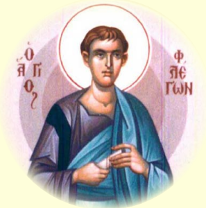
Ὁ Ἅγιος Ἀπόστολος Φλέγων, ἐκ τῶν Ὁ', Ἐπίσκοπος Μαραθῶνος.