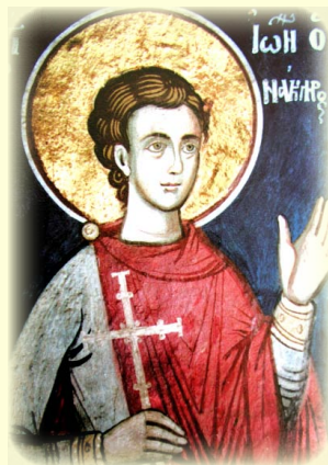
Ὁ Ἅγιος Νεομάρτυς Ἰωάννης, ὁ Ναύκληρος, ὁ ἐν Κῶ.