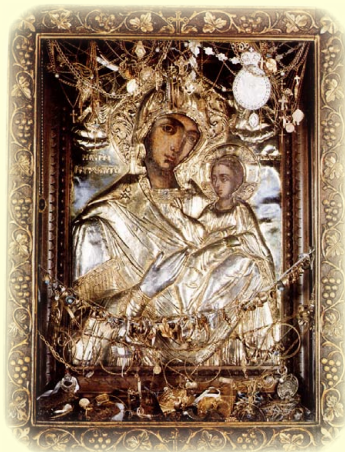
Σύναξις τῆς Ἱερᾶς Εἰκόνας τῆς Ὑπεραγίας Θεοτόκου, τῆς ἐπονομαζομένης «Τρυπητή».