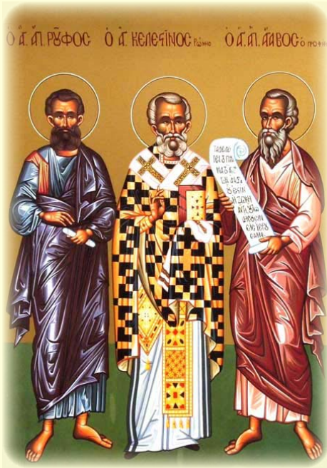
Ὁ Ἅγιος Ἀπόστολος Ροῦφος, ἐκ τῶν Ὁ', Ἐπίσκοπος Θηβῶν, ὁ Ὅσιος Κελεστίνος Πάπας Ρώμης καὶ ὁ Ἅγιος Ἀπόστολος Ἄγαβος, ἐκ τῶν Ὁ', ὁ Προφήτης.