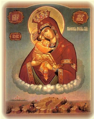
Σύναξις τῆς Ἱερᾶς Εἰκόνας τῆς Ὑπεραγίας Θεοτόκου, ἐν τῇ Ἱερᾷ Λαύρᾳ τοῦ Ποτσάεβ.