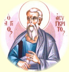
Ὁ Ἅγιος Ἀπόστολος Ἀσύγκριτος, ἐκ τῶν Ὁ', Ἐπίσκοπος Ὑρκανίας / Ὀρκανίας (ΝΔ Ἀσία).