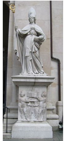
Ἀνδριάντας τοῦ Ἁγίου Βιργιλίου. Στὸν καθεδρικὸ Ναὸ στὸ Σάλτσμπουργκ.

Ἐκανε ἰδιαίτερη προσπάθεια νὰ ἐκπαιδεύσῃ νέους συνεργάτες, πρᾶγμα ποὺ εὐνοήθηκε, ἐπειδὴ ἡ φήμη του γιὰ τὴν ἀγιότητα καὶ τὴν μὀρφωσί του εἶχε προηγηθῆ, καὶ ὁ Βιργίλιος ἀποδείχθηκε στὴν