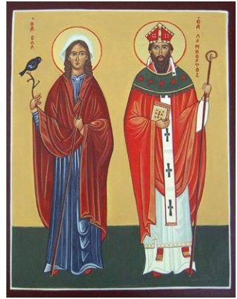
Ἡ Ὁσία Ὁδᾶ καὶ ὁ Ἅγιος Λαμβέρτος.

Σ ὺν τῷ χρόνῳ, πολλοὶ ἄνθρωποι ἤλθαν νὰ μείνουν ἐκεῖ καὶ στὰ