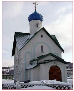
Ὁ Ναὸς τοῦ Ἁγίου Βαρλαάμ. Κόλα.

Ἐ ν συνεχείᾳ, ἐμφανιζόταν συχνὰ σὲ ὅσους ἐκινδύνευαν στὴν θάλασσα. Γ ιὰ τὸν λόγο αὐτό, στὶς ἀρκτικές αὐτὲς περιοχὲς τιμᾶται ὡς Προστάτης ὅσων ἐπιχειροῦν θαλασσινὰ ταξίδια.