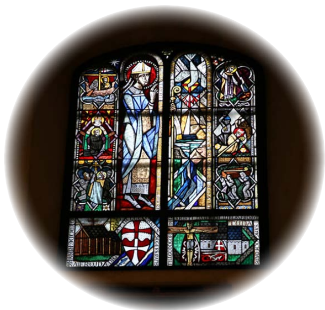
Fönster med bilder från Helige Eskils liv och hans källa i Fors kyrka, Eskilstuna, gjort av konstnären Bengt Olof Kälde 1987.

Moder Magdaleni Heliga Philothei Ortodoxa kloster