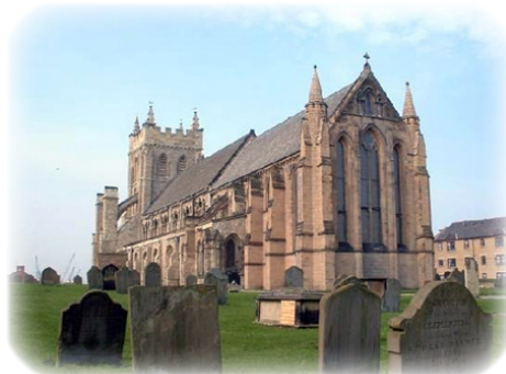
Ναὸς τοῦ Χάρτλπουλ.