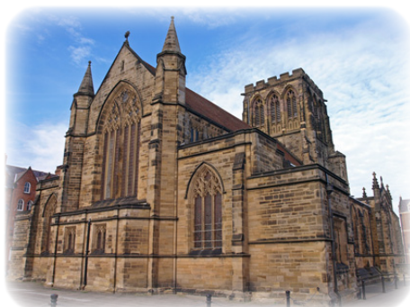
Ναὸς τῆς Ἁγίας Χίλντας στὸ Χουίτμπυ.